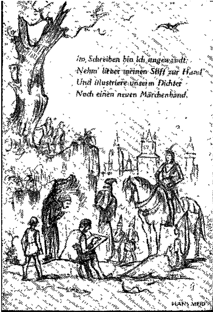
Gruß und Wunsch, gezeichnet von Hans Meid (Aus „Bekenntnis zu Ernst Wiechert“)